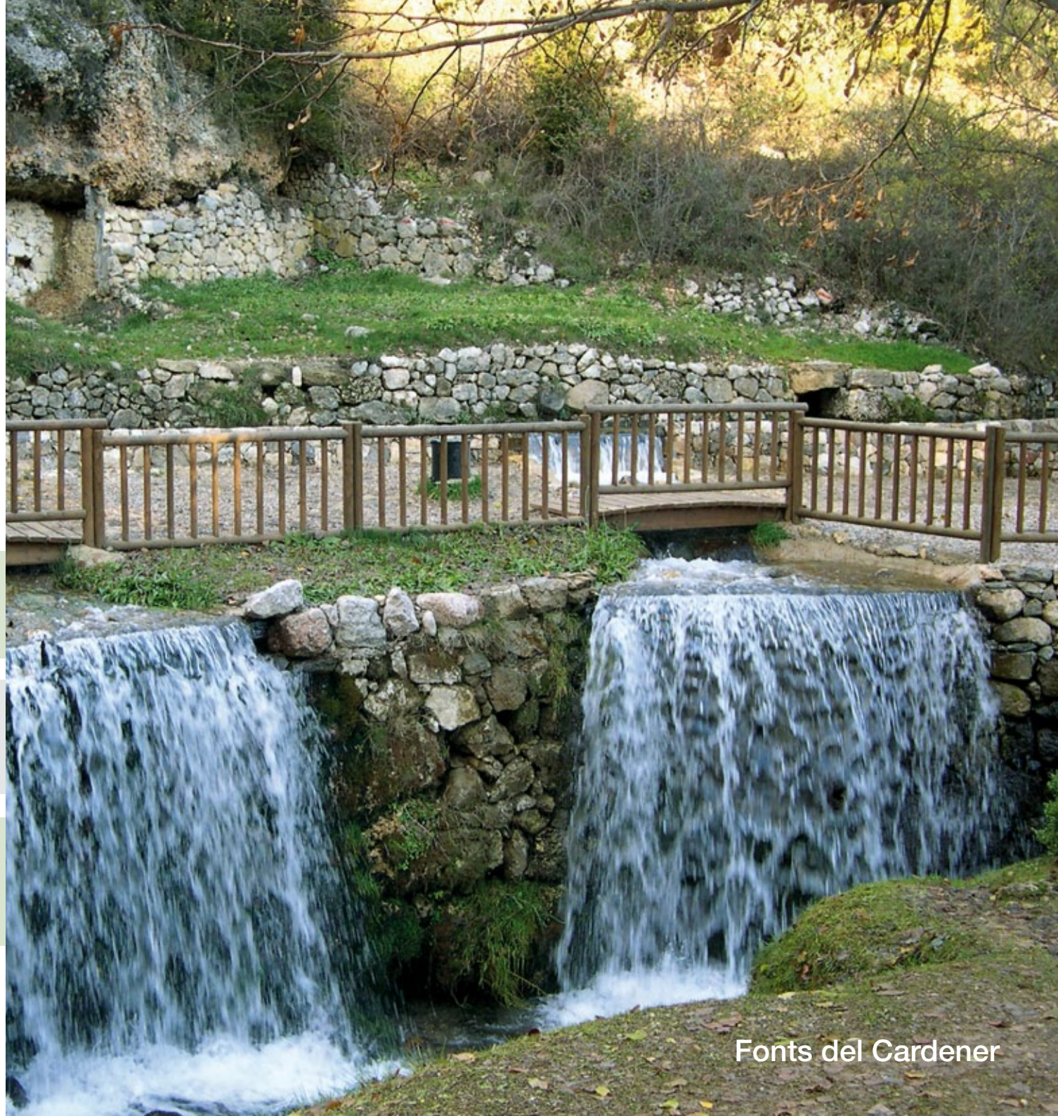
Fonts del Gardener