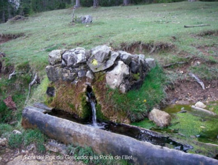
Font del Prat del Gespador a la Poble de l'Illet.

Una font natural és un raig d'aigua subterrània que brolla de la terra cap a la superfície de manera natural.